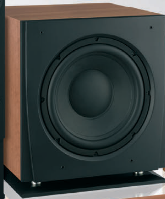
DALI IKON SUB MK2