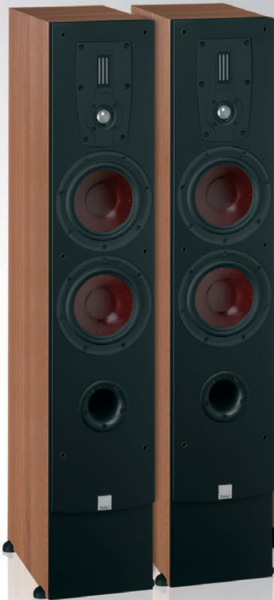
DALI IKON 6 MK2