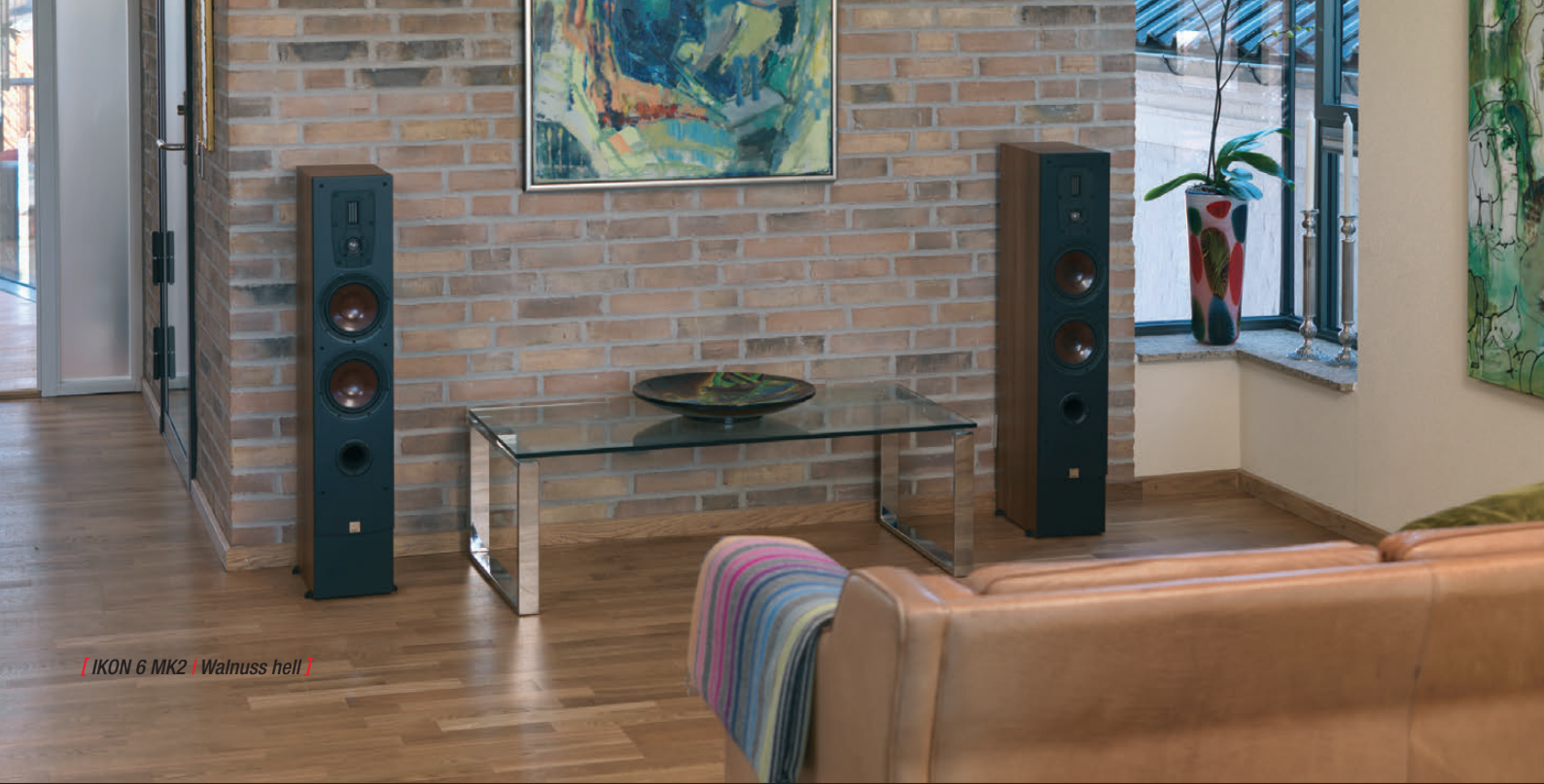
IKON 6 MK2 | Walnuss hell