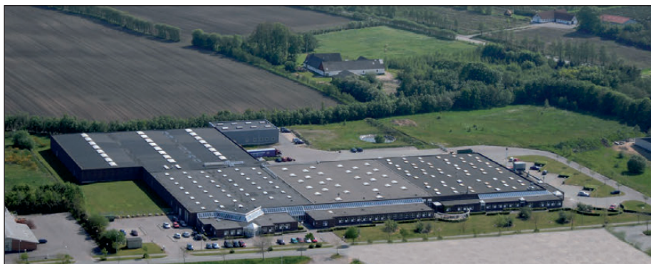
DALI headquarters, Denmark

DALI-Produkte genießen einen hervorragenden Ruf für ihre Qualität, Zuverlässigkeit und Integrität. Hinter DALI stehen reine Leidenschaft für Musik und ein tiefer Respekt für ihre künstlerischen Interpreten. Neue Technologien zu entwickeln und zu verfeinern, um das Unterhaltungserlebnis zuhause noch authentischer zu gestalten, ist unser Hauptziel. Wir möchten das schaffen, was wir für die besten Lautsprecher der Welt halten.