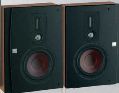
DALI IKON ON-WALL MK2